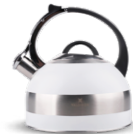
VALDINOX PURE czajnik 3L