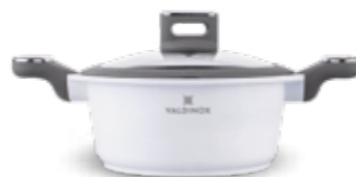
VALDINOX PURE garnek 20 cm z pokrywą