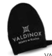
VALDINOX łapka/uchwyt kuchenny 16x13 cm