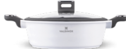
VALDINOX PURE rondel 28 cm z pokrywą