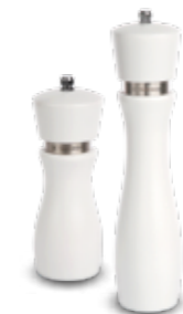
VALDINOX młynek do przypraw biały