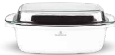
VALDINOX PURE brytfanna 32 x 21 cm z pokrywą