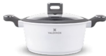
VALDINOX PURE garnek 24 cm z pokrywą